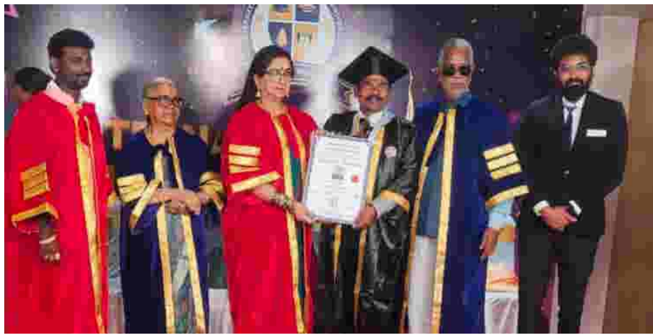
சர்வதேச தமிழ் பண்பாட்டு பல்கலைக்கழகம் நடத்திய மாபெரும் மதிப்புறு முனைவர் பட்டம் அளிப்பு விழா மிகச்சிறப்பாக சென்னையில் மயிலாப்பூர், தெற்கு மாட வீதியில் உள்ள ஹோட்டல் கற்பகம் இண்டர்நேசனல் கலையரங்கத்தில் உயர்நீதிமன்றத்தில் சிறப்பு வாய்ந்த மற்றும் ஓய்வு பெற்ற முன்னாள் நீதியரசர் வெங்கடேசன் மற்றும் அவரது துணைவியாரோடு மற்றும் கலைமாமணி டாக்டர் அம்பிகா 150க்கும் மேற்பட்ட பல்வேறு துறைகளில் சாதனை நிகழ்த்தியவர்களை அடையாளம் கண்டு அவர்களின் ஒவ்வொரு சாதனைகளை பற்றிய ஆய்வுசுட்டி நிபுணர்களுமுன்னால்தேர்ந்தெடுக்கப்பட்டு டாக்டர் சட்ட ஆலோசகர் மற்றும் மனித உரிமைகள் வழக்கறிஞர் துணைவேந்தர் J. மணிகண்ட ராஜா முன்னிலையில் பல்கலைக்கழக வேந்தர் டாக்டர் கொற்றவை நாகராஜன், முக்கிய பிரமுகர்களுடன் ஈரோடு போராளியர் கோ. தங்கவேலர் அவர்களுக்கு கல்வியியல் முனைவர் எனும் டாக்டர் பட்டம் வழங்கி கௌரவித்தார்.