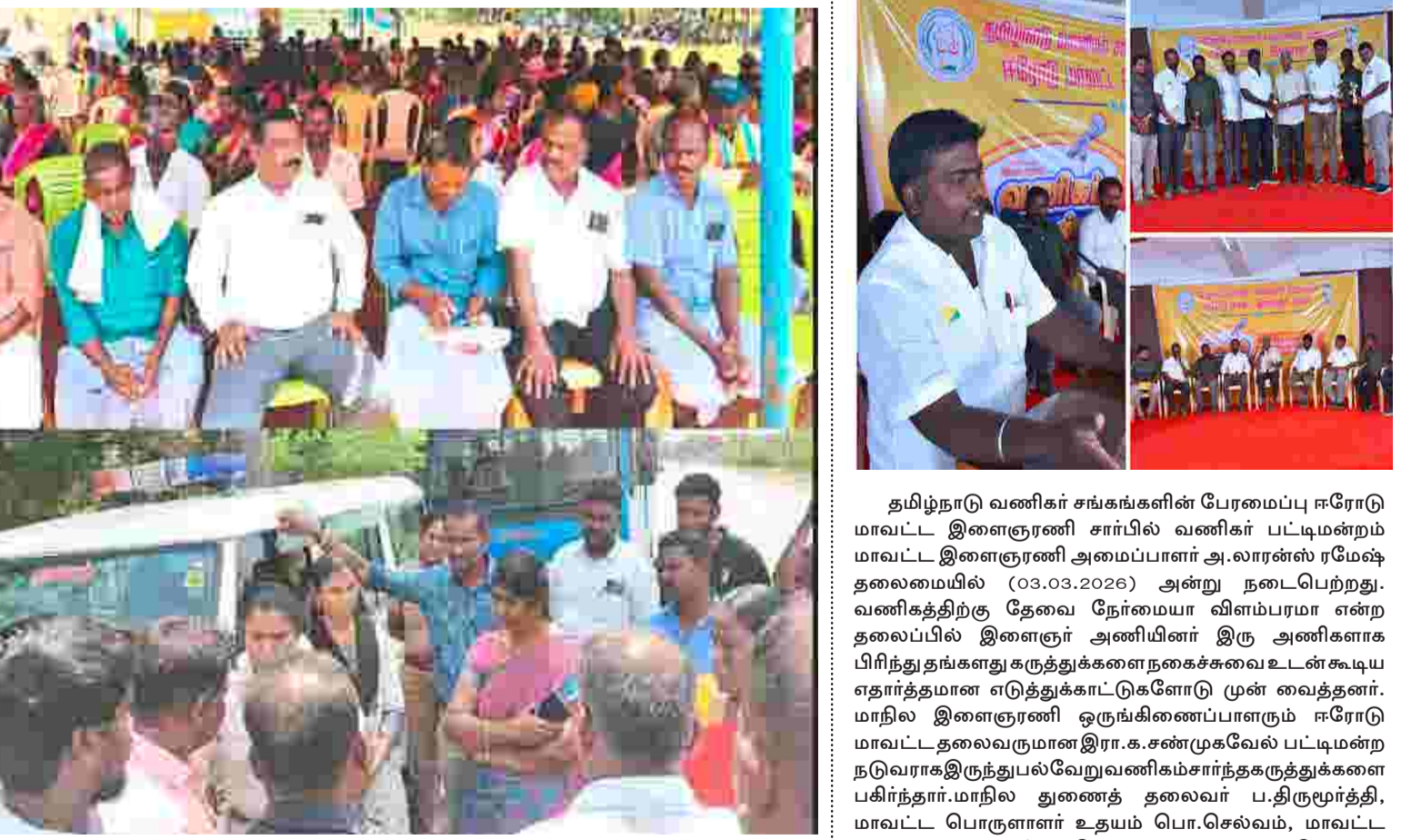
சிவகங்கை மாவட்டம் இளையங்குடி பேரூராட்சியில் சுற்றுச்சூழல் விதிகளுக்கு மாறாக இளையங்குடி பெரிய கண்மாய்க்கு செல்லும் கால்வாய் அருகில் குப்பை கிடங்கு அமைக்க எதிர்ப்பு தெரிவித்து கொ.இடையவலசை, அ.மெய்யனேந்தல், நகரகுடி உள்ளிட்ட ஊராட்சிகளை சேர்ந்த கிராம மற்றும் விவசாய பொதுமக்கள் 300க்கும் மேற்பட்டோர் ஸ்ரீ தடியார் உடையார் அய்யனார் திருக்கோவில் அருகில் போராட்டத்தில் ஈடுபட்டு வருகின்றனர். இப்போராட்டத்தை தொடர்ந்து சமூக பாதுகாப்புத் திட்ட தாசில்தார், மண்டல துணை வட்டாட்சியர் மற்றும் இளையங்குடி பேரூராட்சி செயல் அலுவலர் உள்ளிட்டோரிடம் பேச்சுவார்த்தை நிறைவடைந்த நிலையில், தங்களின் கோரிக்கையை ஏற்று எழுத்துப்பூர்வமாக அறிவிக்கும் வரை போராட்டம் தொடரும் என போராட்டத்தில் ஈடுபட்டுள்ள விவசாய பெருமக்கள் தெரிவித்துள்ளனர். மேலும் போராட்டம் நடக்கும் இடத்திலேயே விவசாய பெருமக்கள் உணவுகளையும் தயாரித்து வருகின்றனர்.