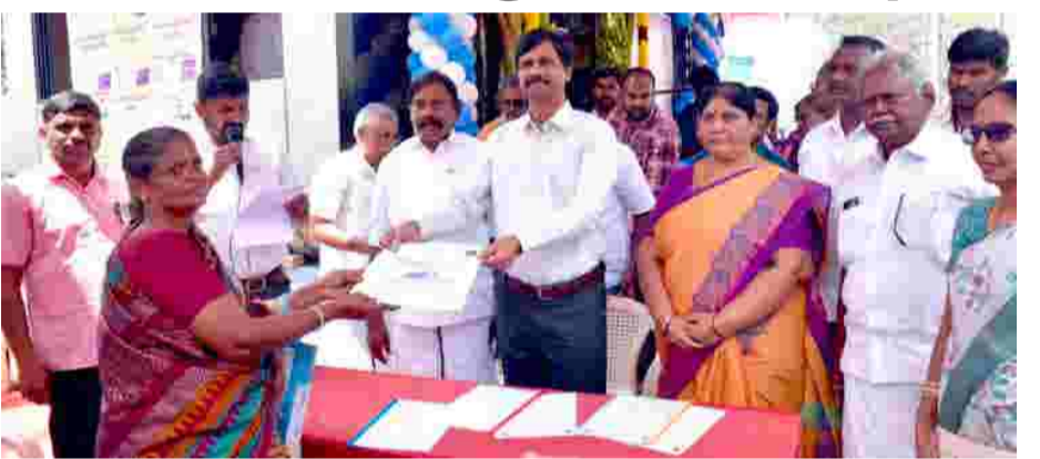
னத்தொழிலாளர்களின் 2 வாரிக் தாரர்களுக்கு மதிப்பீட்டிலும், 5,50,000/- தொழிலாளர்கள் 4 5,10,000/- தலா திருமண உதவித்தொகையும், கட்டுமான வாரிக் தாரர்களுக்கு ரூ.14,500/- மதிப்பிலான கல்வி உதவித்தொகை என மொத்தம் 8 பயனாளிகளுக்கு ரூ.2,33,500/- மதிப்பிலான நலத்திட்ட உதவிகளை வழங்கினார். இந்த நிகழ்ச்சிகளில் போது, ஈரோடு அந்தியூர் சட்டமன்ற உறுப்பினர் ஏ.ஜி.வெங்கடாச்சலம், ஈரோடு மாநகராட்சி மேயர், நாக-

ஈரோடு மாவட்டத்தில் ஒரு அடிப்படை வசதி மையம் அமைக்க உத்தரவின்படி, ஈரோடு மாவட்டத்தில் நிறுவப்பட்ட அடிப்படை வசதி மையமானது இன்று துவக்கி வைக்கப்பட்டு கட்டுமானத் தொழிலாளர்களின் பயன்பாட்டிற்கு கொண்டுவரப்பட்டது. உழைப்பாளர் நலக்கூடத்தில், மின் விளக்கு மற்றும் மின்விசிறி வசதிகள், குடிநீர் வசதி, இருக்கை வசதி போன்ற வசதிகளில் அமைக்கப்பட்டுள்ளது. இந்த உழைப்பாளர் நலக்கூடமானது காலம் 7 மணி முதல் 11 மணி வரை பயன்பாட்டில் இருக்கும். இந்த நலக்கூடத்தில் இணையுள்ள சேவை மடிக் கணினியோடு ஒருகணினி இயக்குபவர், பணியில் இருப்பார். இந்த நலக்கூடத்தினை அன்றாடம் கட்டுமானப் பணிக்கு செல்லும் தொழிலாளர்கள் பயன்படுத்திக்கொள்ளலாம். நேற்றைய தினம், மாவட்ட ஆட்சித்தலைவர் அவர்கள், தொழிலாளர் நலத்துறையின் சார்பில் தமிழ்நாடு கட்டுமான தொழிலாளர்கள் நல வாரியத்தின் பதிவு பெற்ற கட்டுமான தொழிலாளர்களுக்கான வீட்டு வசதி திட்டத்தின் கீழ் நகர்ப்புற வாழ்விட மேம்பாட்டு வாரியத்தால் கட்டப்பட்டுள்ள குடியிருப்புகளில் வீடு ஒதுக்கீட்டு ஆணையினை 2 பயனாளிகளுக்கும் தலா ரூ.1,90,000/- வீதம் ரூ.3,80,000/- கட்டுமா-