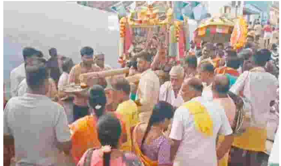
ஈரோடு மாவட்டம், சத்தியமங்கலம் அருகே உள்ள பண்ணாரியில் பிரசித்தி பெற்ற அருள்மிகு ஸ்ரீ பண்ணாரி அம்மன் கோவில் குண்டம் திருவிழா வரும் 31ஆம் தேதி நடைபெற உள்ளது. இதையொட்டி, அம்மன் உற்சவச் சம்பரம் சுற்று வட்டார கிராமங்களில் திருவிழா உலா வந்து பக்தர்களுக்கு அருள்பாலித்து வருகிறது. அந்த வகையில், நேற்று சிக்கரசம்பாளையம் கிராமத்திற்கு வருகை தந்த சப்பரத்தைப் பொதுமக்கள் உற்சாகமாக வரவேற்று, சிறப்பு பூஜைகள் செய்து அம்மனை மனமுருகி வழிபட்டனர்.