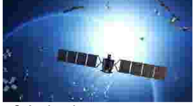
இந்தியாவின் விண்வெளி ஆய்வு மையத்தால் கடந்த 2013-ஆம் ஆண்டு விண்வெளியில் நிலைநிறுத்தப்பட்ட இந்திய மண்டல வழிகாட்டி செயற்கைக்கோள் (நேவிக்) அமைப்பின் அணு கடிசாரம் செயலிழந்து, செயற்கைக்கோளின் செயல்பாடுகளில் பாதிப்பு ஏற்படும் நிலை உருவாகியிருக்கிறது. ஐ.ஆர்.எஸ்.எஸ்-13-ஆம் தேதி அறிவித்தி-

டுமே உள்ளன, அவையும் அபாயத்தில் உள்ளதாகத் தகவல்கள் தெரிவிக்கின்றன. செயற்கைக்கோள் இணைக்கப்பட்டிருந்த அந்த அணு கடிசாரம், 10 ஆண்டுகளுக்கும் மேலான தன்னடைய இடைவிடாத செயல்பாட்டை நிறுத்தியிருக்கிறது. 1999-ஆம் ஆண்டில், கார்சில் போரின்போது, இடத் தரவு உள்ளிட்ட விவரங்களை வழங்க அமெரிக்கா மறுத்து விட்டது. இந்த பின்னடைவு போரின்போது பாதுகாப்புப் படைக்கு மிகப்பெரிய சாவலாக இருந்தது. இதனால், இந்தியா தன்னுடைய தற்சார்பை உறுதி செய்ய தனது செயற்கைக்கோள்களைக் கொண்ட இந்திய மண்டல வழிகாட்டி செயற்கைக்கோள் அமைப்பை உருவாக்கி விண்வெளியில் நிலைநிறுத்தி செயல்படுத்தியுள்ளது. தற்போது இந்தியாவின் உள்நாட்டு செயற்கைக்கோள் வழி-