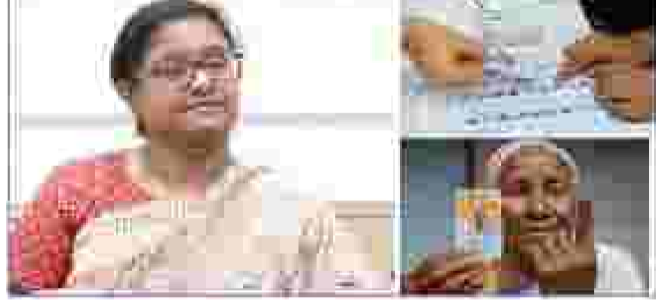
சென்னை: வாக்காளர் புகைப்பட அடையாள அட்டையை அளிக்க இயலாத வாக்காளர்கள் இந்திய தேர்தல் ஆணையம் பட்டியலிட்ட மாற்று புகைப்படத்துடன் கூடிய 12 ஆவணங்கள் காண்பித்து வாக்களிக்கலாம் என்று மாநில தலைமைத் தேர்தல் அதிகாரி அறிவுறுத்தியுள்ளார். இது குறித்து மாநில

பதற்காக பின்வரும் மாற்று புகைப்பட அடையாள ஆவணங்களில் ஏதேனும் ஒன்றை காண்பிக்க வேண்டும் என இரண்டாம் பணிக் கீழ் தேர்தல் ஆணையம் ஆணையிட்டுள்ளது. அதன்படி, ஆதார அட்டை, மகாத்மா காந்தி தேசிய ஊரக வேலை உறுதியளிப்புத் திட்டத்தின் பணி அடையாள அட்டை, கூடிய வங்கி, அஞ்சலக கணக்குப் புத்தகங்கள், தொழிலாளர் நல அமைச்சுக் கீழ் திட்டத்தின் கீழ் வழங்கப்பட்ட மருத்துவ காப்பீட்டு அட்டை, ஆயுஷ்மான் பாரத் மருத்துவ காப்பீட்டு அட்டை, ஒட்டுநர் உரிமை, வருமான வரி நிரந்தர காண்கு எண் அட்டை (PAN Card), தேசிய மக்கள் தொகை பதிவேட்டின் கீழ் இந்திய தலைமைப்