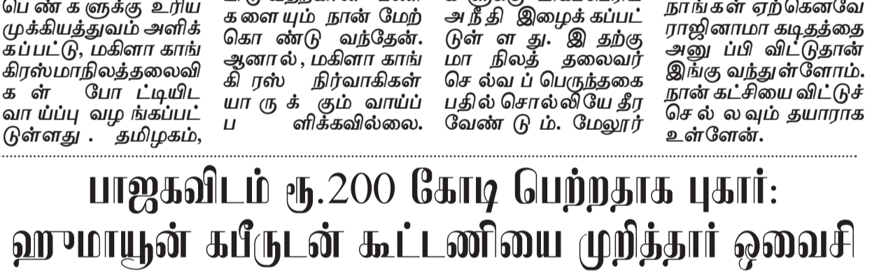
சென்னை: ஹுமாயூன் கபீருடன்