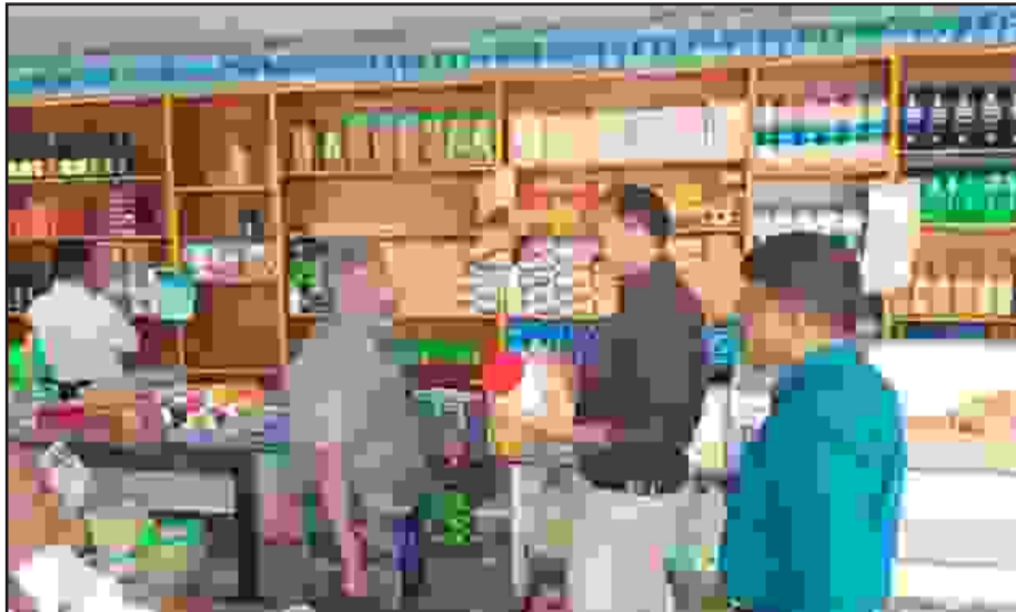
கன்னியாகுமரி மாவட்ட ஆட்சியர் அவர்களின் உத்தரவின்படி, தோவாளை வட்டாரத்தில் உள்ள செண்பகராமன் புதூர் பகுதியில் உள்ள மனிகை கடைகள், தேநீர் கடைகள், இறைச்சி கடைகள் மற்றும் உணவகங்கள் உள்ளிட்ட பத்திரகம் மேற்பட்ட கடைகள் நேற்று மாவட்ட நியமன அலுவலர் தலைமையிலான உணவு பாதுகாப்பு அலுவலர் குழுவின் மூலம் திடீர் ஆய்வு செய்யப்பட்டன. ஆய்வில், உற்பத்தி தேதி மற்றும் காலாவதி குறிப்பிடப்படாத மற்றும் காலாவதியான சுமார் 10 கிலோ எடை கொண்ட உணவுப் பொருட்கள் மற்றும் தடை செய்யப்பட்ட 1 கிலோ பாலிதீன் பைகளும் பறிமுதல் செய்து அழிக்கப்பட்டது. மேலும் சுகாதார குறைபாடுகளுடன் இயங்கிவந்த 5 கடைகளுக்கு தலா ரூபாய் 1000 வீதம் 5000 ரூபாய் மற்றும் தடை செய்யப்பட்ட பாலிதீன் பைகளை பயன்படுத்திய இரண்டு கடைகளுக்கு தலா 5000 ரூபாய் அபராதமும் விதித்து நடவடிக்கை மேற்கொள்ளப்பட்டது.