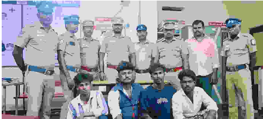
கள்ளக்குறிச்சி மாவட்டம் உளுந்தூர்பேட்டை அருகே எடைக்கல் காவல் நிலையம் எல்லைக்குட்பட்ட பகுதியில் உள்ள விவசாய நிலங்களில் கிணற்றின் மோட்டார் வயர்களை திருடிய 4 பேரை எடைக்கல் போலீசார் கைது செய்து விசாரணை மேற்கொண்டு வருகின்றனர்

ஈரோடு மாவட்டத்தில் உள்ள கோபி வட்டம் கூகலூர் கிராமத்தில் அரசு உதவி பெறும் காந்தி கல்வி நிலையம் மேல்நிலைப் பள்ளி செயல்படுகிறது. கோடை விடுமுறை முடிந்து, 2026 ஆம் கல்வி ஆண்டின் முதல் நாளான (ஜூன்.4) அன்று பள்ளி மாணவ மாணவிகளுக்கு, அரசின் நலத்திட்ட உதவிகள் மூலம் ஆண்டு தோறும் வழங்கப்படும் நோட்டு, புத்தகங்கள், சீருடை மற்றும் காலணிகள் வழங்கப்பட்டது. இதனை ஆர்வத்துடன் பெற்றுக் கொண்ட மாணவர்கள் அரசுக்கு நன்றி தெரிவித்தனர்.