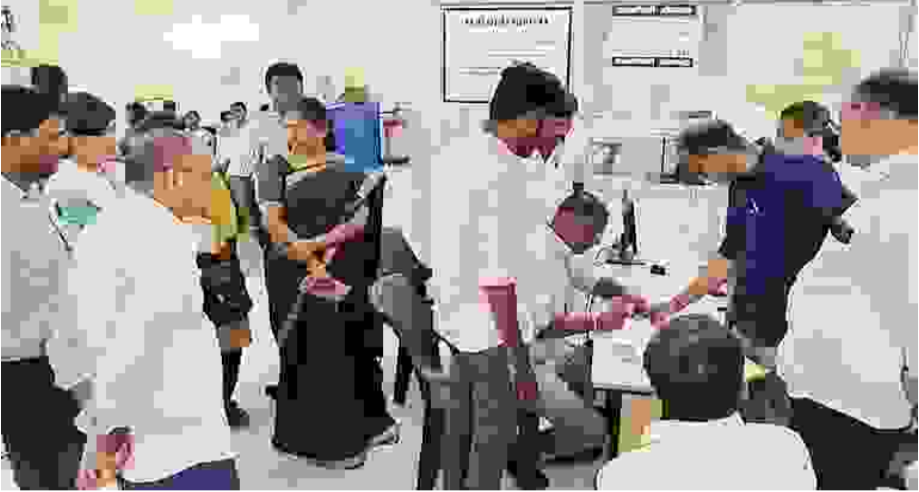
சென்னை: பதிவுத்தொழில் இணையவழியில் "வருகை இல்லா ஆவணப்பதிவு" (Anywhere Registration) கட்டாயமாகத் தொடர்பான அறிவிப்பு தமிழக பத்திரப் பதிவுத்துறை சார்பில் வெளியிடப்பட்டுள்ளது. இதுதொடர்பாக தமிழக பத்திரப் பதிவுத்துறை தலைவர் வெளியிடப்பட்டுள்ளது.

முள்ள செய்திக்குறிப்பு: ஆவணப்பதிவு நடைமுறைகளை எளிமைப்படுத்த பொதுமக்கள் தாங்களே நேரடியாக இணையவழியே ஆவணப்பதிவு செய்வதற்கான முறையை பதிவுத்துறை அறிமுகப்படுத்தியுள்ளது. இந்த ஆவணப்பதிவு முறை மூலம் பொதுமக்கள் சார்பிவாளர் அலுவலகங்களுக்கு நேரில் செல்லாமல் எங்கிருந்தும் எப்போது வேண்டுமானாலும் (24x7x365) இணையதளத்தின் மூலம் இணையவழி தங்களது ஆவணங்களை பதிவு செய்து கொள்ள முடியும். ஆவணப் பதிவிற்கு சார்பிவாளர் ஒப்புதல் அளித்ததும், சார்பிவாளரின் மின்னணுகையொப்பத்துடன் ஆவணமானது சம்பந்தப்பட்ட நபரின் உள்நுழைவிற்கும் அலைபேசிக்கு புலனம் (Whatsapp) மூலமும் அனுப்பி வைக்கப்படும். அந்த ஆவணத்தை ஆவணதாரர்கள் தங்கள் உள்நுழைவுவழியே தரவிறக்கம் செய்து கொள்ளலாம். "வருகை இல்லா ஆவணப்பதிவு" (Anywhere Registration) நடைமுறை விரைவில் கட்டாயமாக்கப்பட உத்தேசிக்கப்பட்டுள்ளதைக் கருத்தில்