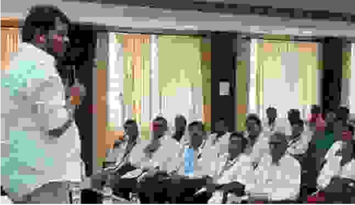
கைத்தறி துறை அமைச்சர் விஜயபாலாஜி ஈரோடு அரசு மருத்துவமனை கூட்ட அரங்கில் நடைபெற்ற ஆலோசனை கூட்டத்தில் பங்கேற்றார். பொதுமக்களுக்குத் தரமான சிகிச்சை அளிப்பது மற்றும் நோயாளிகளின் பாதுகாப்பை உறுதி செய்வது குறித்து இதில் ஆலோசிக்கப்பட்டது. இக்கூட்டத்தில் மேற்கு சட்டமன்ற உறுப்பினர் கே.கே.ஆனந்த் மோகன் மற்றும் அரசு மருத்துவர்கள் கலந்துகொண்டு ஆலோசனைகளை வழங்கினர்.