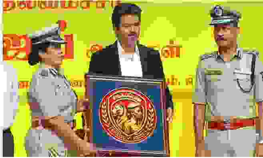
முதல்-அமைச்சராக பெண்கள் பாதுகாப்புக்-வாக்கப்படும் என்று விஜய் பொறுப்பேற்றவு-அறிவித்தார். இதைத்-டன், குழந்தைகள், அதிரடிப் படை உரு-தொடர்ந்து, இந்த

அதிர்வுப் படையின் முதல் பெண் ஐ.ஜி.யாக பவானிஸ்வரி நியமிக்கப்பட்டு உள்ளார். இந்த படையில் ஒரு போலீஸ் சூப்பிரண்டு, 2 துணை போலீஸ் சூப்பிரண்டு கள் மற்றும் 4 இன்ஸ்பெக்டர்கள் உள்பட 30-க்கும் மேற்பட்ட போலீ-சார் நியமிக்கப்பட்டு உள்ளனர். இந்த அதிரடிப்படையின் இடம்பெறும்பெண் போலீஸ் மற்றும் பெண் சப்-இன்ஸ்பெக்டர்களுக்கும் மேற்பட்ட போலீ-சார் நிற சட்டை, காக்கி நிற பேண்ட் என சிறப்பு சீருடை வழங்கப்பட்டுள்ளது. அத்துடன் கருப்பு நிற தொப்பியும், கருப்பு நிற ஷூவும் வழங்கப்பட்டுள்ளது.