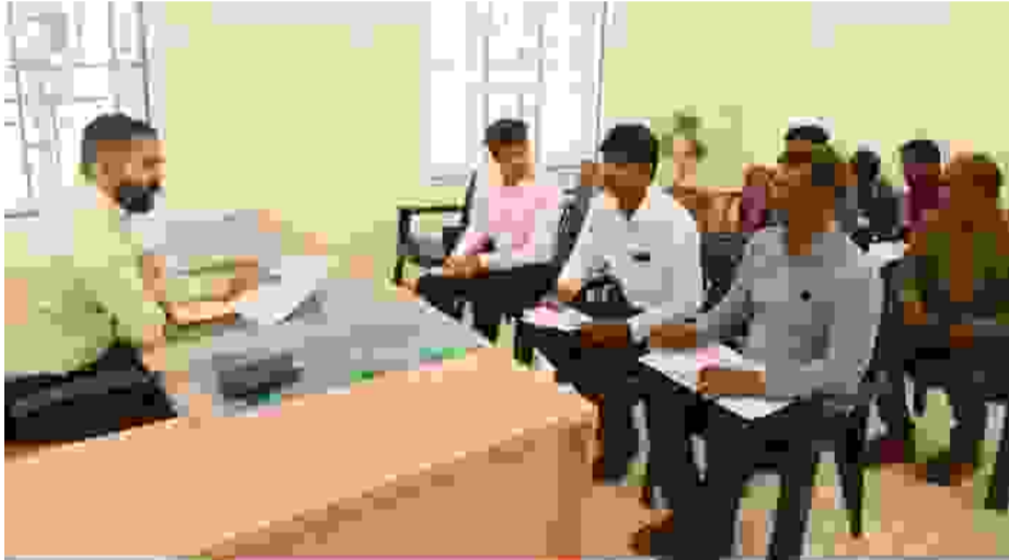
மதுரை மாவட்டம், கொட்டாம்பட்டி ஊராட்சி ஒன்றிய அலுவலக கூட்டரங்கில், கொட்டாம்பட்டி ஊராட்சி ஒன்றியத்திற்குட்பட்ட வஞ்சிநகரம் கிராமத்தில் சிப்காட் தொழில்பேட்டை அமைப்பது தொடர்பாக தொடர்புடைய அலுவலர்களுடன் ஆய்வுக் கூட்டம் நடைபெற்றது. இக்கூட்டத்தில் தொழில்பேட்டை அமைப்பதற்கான நிலம், அடிப்படை உட்கட்டமைப்பு வசதிகள், சாலை வசதிகள், மின்சாரம், குடிநீர், வடிகால் வசதி உள்ளிட்ட அம்சங்கள் குறித்து விவாதிக்கவும் மேற்கொள்ளப்பட்டு, பணிகளை விரைந்து மேற்கொள்ள தேவையான நடவடிக்கைகளை மாவட்ட ஆட்சியர் அலுவலர்களுக்கு அறிவுறுத்தினார்.