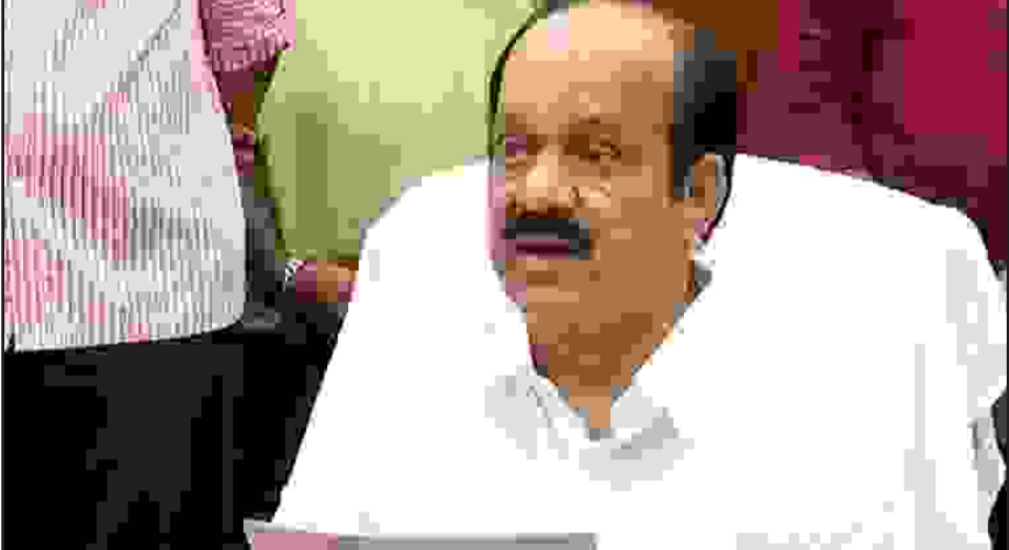
தமிழக சட்டசபையில் கடந்த மாதம் 13-ந் தேதி நடைபெற்ற நம்பிக்கை வாக்கெடுப்பில் த.வெ.க. அரசு வெற்றி பெற்றது. ஆதரவாக 144 வாக்குகளும், எதிராக 22 வாக்குகளும் கிடைத்தன. 5 பேர் நடுநிலை வகித்தனர். தி.மு.க. வெளிநடப்பு செய்தது. இதில், அ.தி.மு.க.வை சேர்ந்த 25 உறுப்பினர்களும்