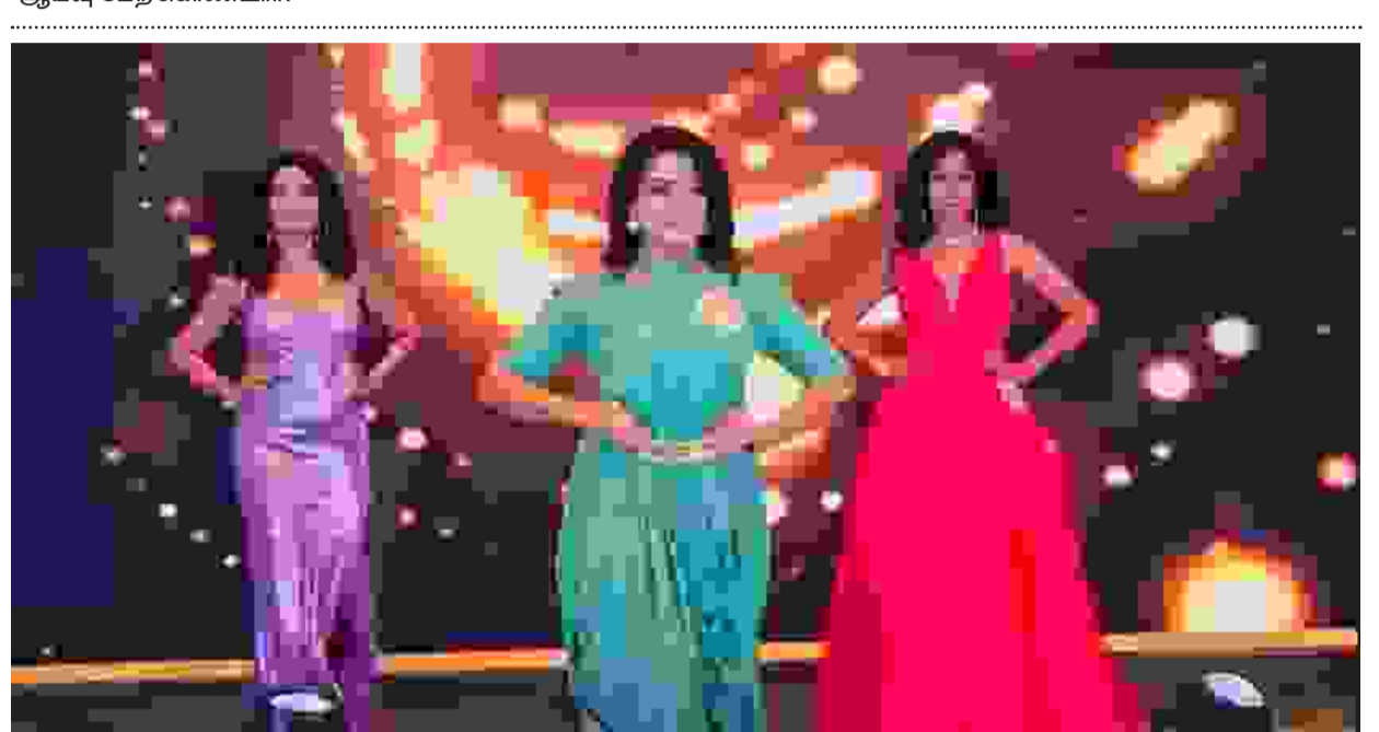
கோவையில் குயின் ஆப் கோயம்புத்தூர் என்ற பெயரில் நடைபெற்ற அழகிய போட்டியில் அழகுப் பெண்கள் அன்னந்தை போட்டு பார்வையாளர்களின் கவனத்தை ஈர்த்தனர். பெண்களின் திறமைகள், தன்னம்பிக்கை, தனித்துவம் மற்றும் ஆளுமை வளர்ச்சியை வெளிப்படுத்தும் நோக்கில் ராவ் மருத்துவமனை மற்றும் ரோட்டரி கிளப் ஆஃப் கோயம்புத்தூர் சார்பில் குயின் ஆப் கோயம்புத்தூர் என்ற பழகிய போட்டி கோவையில் நடைபெற்றது. இதன் இறுதிச்சுற்று இன்று அவிநாசி சாலையில் உள்ள தனியார் விடுதியில் நடைபெற்றது. இந்நிகழ்ச்சியில் பல்வேறு கட்டத் தேர்வுகளை வெற்றிகரமாக கடந்த போட்டியாளர்கள் பங்கேற்று, தங்களது திறமைகளையும் ஆளுமையையும் வெளிப்படுத்தினர். மேலும், பிரபல திரைப்பட நடிகை ஹன்சிகா மோதவானி சிறப்பு விருந்தினராக கலந்து கொண்டு வெற்றியாளர்களுக்கு மகுடம் சூட்டி கௌரவித்தார்.