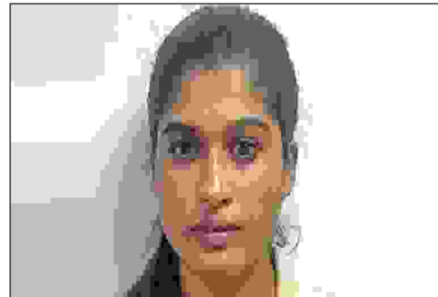
சத்பரதி சிவாஜி மகாராஜ் சர்வதேச விமான நிலையம் வந்திருக்கினார். அப்போது அவரது நடத்தை சந்தேகத்திற்கு இடமளிக்கும் வகையில் இருந்ததால் விமான நிலையத்தில் அதிகாரிகளால் கைது செய்யப்பட்டார்.

மும்பை: தாய்லாந்தில் இருந்து மும்பை வந்திருக்கிய 28 வயது மாடல் அழகி ஒருவர், 11 கிலோவுக்கும் அதிகமான உயர்தர கஞ்சா கடத்தி வந்ததற்காக கைது செய்யப்பட்டு சிறையில் அடைக்கப்பட்டார்.