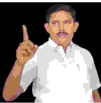
தொடர்ந்து அதிகரித்து வருவதனால் பெண்களுக்கு அச்சத்தை ஏற்படுத்தும் வகையில் உள்ள சிறுமியின் குடும்பத்தார்களுக்கு ஆழ்ந்த அனுதாபங்களையும் இரங்கலையும் தெரிவித்து கொள்கிறோம். உயிரிழந்த சிறுமியின் குடும்பத்திற்கு ரூ 50 லட்சம் தமிழக அரசு வழங்க வேண்டும்.