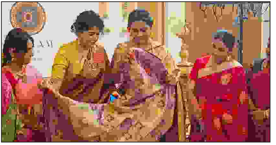
ரூ.4.5 லட்சம் மதிப்பிலான பட்டுப்புடவை பெண்களின் கவனத்தை ஈர்த்தது. தங்க மற்றும் வெள்ளி ஜரிகை கொண்டு, இளைஞர்களைக் கவரும் விதமாக எடை குறைவாக சேலைகள் வடிவமைக்கப்பட்டுள்ளதாக, பிரேமம் சில்க்ஸ் ஸ்பெஷலிஸ்ட் தெரிவித்தார்.

கோவை அவினாசி சாலையில் உள்ள ரெசிடென்சி டவர் ஹோட்டலில் பிரேமம் கல்யாண வையோகம் என்ற பெயரில் திருமணத்திற்கான பட்டுப்புடவை கண்காட்சி நடைபெற்று வருகிறது. இந்த கண்காட்சியில் பாரம்பரிய மற்றும் நவீன வடிவமைப்புகளுடன் கூடிய ஆயிரத்திற்கும் மேற்பட்ட பட்டுப்புடவைகள் காட்சிப்படுத்தப்பட்டுள்ளன. திருமண சீசனை முன்னிட்டு நடத்தப்படும் இந்த கண்காட்சியில் காஞ்சிபுரம் மட்டுமன்றி இந்தியாவின் பல்வேறு மாநிலங்களில், தேர்ந்தெடுக்கப்பட்ட பாரம்பரிய நெய்வு சேலைகளும் இடம்பெற்றுள்ளன. இதில் பந்தினி, பைதானி, பனாரஸ், காஞ்சிபுரம் உள்ளிட்ட பல்வேறு வகை பட்டுப்புடவைகளை இடம்பெற்றுள்ளன. குறிப்பாக இக்கண்காட்சியில் இடம்பெற்ற