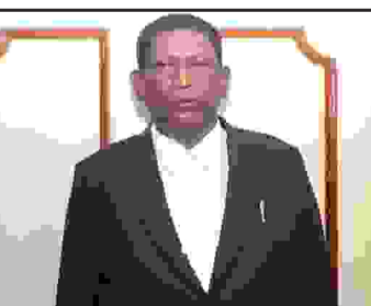
மேற்கு புறவழிச்சாலை கட்ட 10 ஆண்டுகளுக்கு முன்பு ஆரம்பிக்கப்பட்டது, கட்டந்த திமுக மற்றும் அதிமுக ஆட்சியின், மெத்தனப் போக்கால், இந்த திட்டம் ஆமை வேகத்தில் நடைபெற்று வருகின்றது. இந்த திட்டம் காலதாமதம் ஆவதால் கேரளாவில் இருந்து சுற்றுலா பயணிகள் மற்றும் பொது போக்குவரத்து வாகனங்கள், நகர் மையப்பகுதிகளுக்குள் நுழைந்து சாலை அடையவேண்டிய நிலை உள்ளது. அதேபோல ஊட்டி மற்றும் மேட்டுப்பாளையத்தில் இருந்து வரும் கனரக வாகனங்கள் நகரின் மையப்பகுதிக்குள் வந்துதான் பாலக்காடு சாலையை அடைகின்றது. இதனால் நகருக்குள் கரும் போக்குவரத்து நெரிசல் ஏற்பட்டு வருகின்றது. மேற்கு புறவழிச்சாலை திட்டமானது மொத்தம், 38