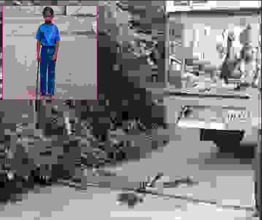
பள்ளி வேளில் சிக்கி 8 வயது சிறுமி உயிரிழந்துள்ளார் ஏற்காட்டில் தினசரி பள்ளி மாணவர்களை ஏற்றி சென்ற தனியார் டிராவல்ஸ் வேளில் சிக்கி 8 வயது சிறுமி பரிதாபமாக உயிரிழந்தார் இந்த சம்பவம் அப்பகுதி மக்களிடம் பெரும் அதிர்ச்சியையும் சோகத்தையும் ஏற்படுத்தியுள்ளது இந்த சம்பவம் குறித்து போலீசார் விசாரணை மேற்கொண்டு வருகின்றனர்.