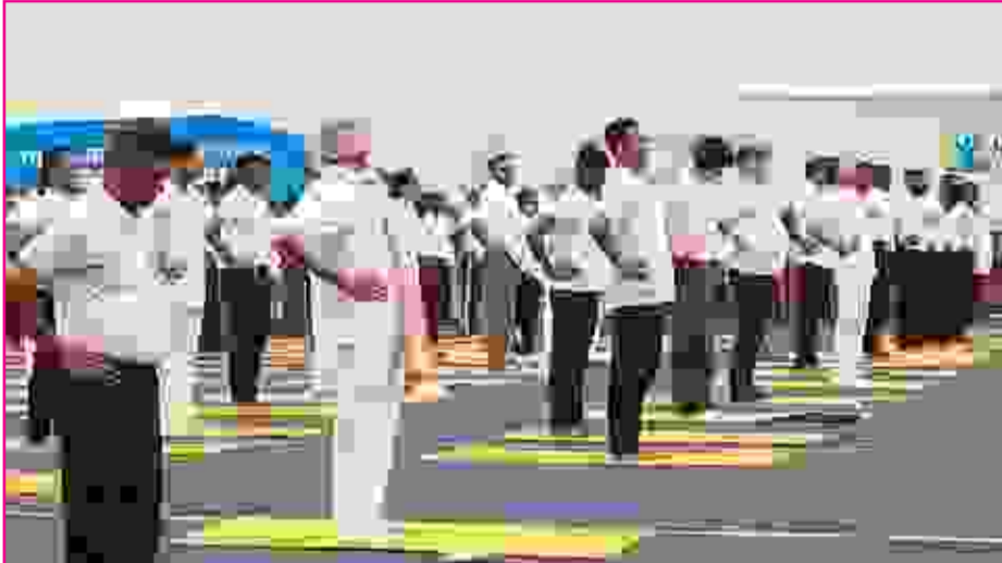
கொல்கத்தா: உலகின் மிகப்பெரிய சமூக கொண்டாட்டமாக யோகா தினம் மாறியுள்ளது என பிர-

கொல்கத்தாவில் நடைபெற்ற சர்வதேச யோகா தினம் நிகழ்ச்சியில் பங்கேற்று பிரதமர் மோடி பெருமிதம்