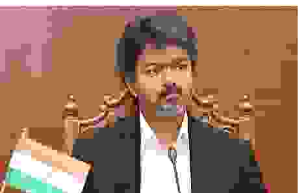
செய்ய தேவையான நடவடிக்கைகள் எடுக்கப்பட்டு உள்ளன. மருத்துவமனையில் அனுமதிக்கப்பட்டுள்ள 62 பேருக்கும் சிறப்பான சிகிச்சை அளிக்க உத்தரவிடப்பட்டுள்ளதுடன், பாதிக்கப்பட்ட அனைத்து தொழிலாளர்களுக்கும் தொழிலாளர் மாநில ஈட்டுறுதி காப்பீட்டு (ESI) திட்டம் அல்லது வேலையாளர் இழப்பீடு சட்டத்தின் கீழ் உரிய இழப்பீட்டுத் தொகையை உடனடியாக வழங்க அரசு நடவடிக்கை எடுத்துள்ளது. அமைச்சர்கள் மற்றும்

மையான காரணங்கள் அடங்கிய இறுதி அறிக்கையினை 3 நாட்களுக்குள்ளாகவும் சமர்ப்பிக்க வேண்டும் என காலக்கெடு விதிக்கப்பட்டுள்ளது. மேலும், எதிர்காலத்தில் இதுபோன்ற விபத்துக்களைத் தவிர்க்கும் பொருட்டு, மாநிலத்தில் உள்ள அனைத்து பேராய தொழிற்சாலைகளிலும் (Hazardous Industries) உடனடியாக குழு ஆய்வுகள் மேற்கொள்ள முதலமைச்சர் உத்தரவிட்டுள்ளார். உயிரிழந்த இரண்டு பெண்களின் குடும்பத்தினருக்கு முதலமைச்சரின் பொது நிவாரண நிதியிலிருந்து தலா இரண்டு லட்சம் ரூபாய் வழங்க முதலமைச்சர் விஜய் உத்தரவிட்டுள்ளார். உயிரிழந்தவர்களின் வெளிமார்பில் தொழிலாளர்கள் என்பதால், அவர்களின் உடல்களை அரசு செலவிலேயே சொந்த மாநிலத்திற்கு அனுப்பி நல்லடக்கம்