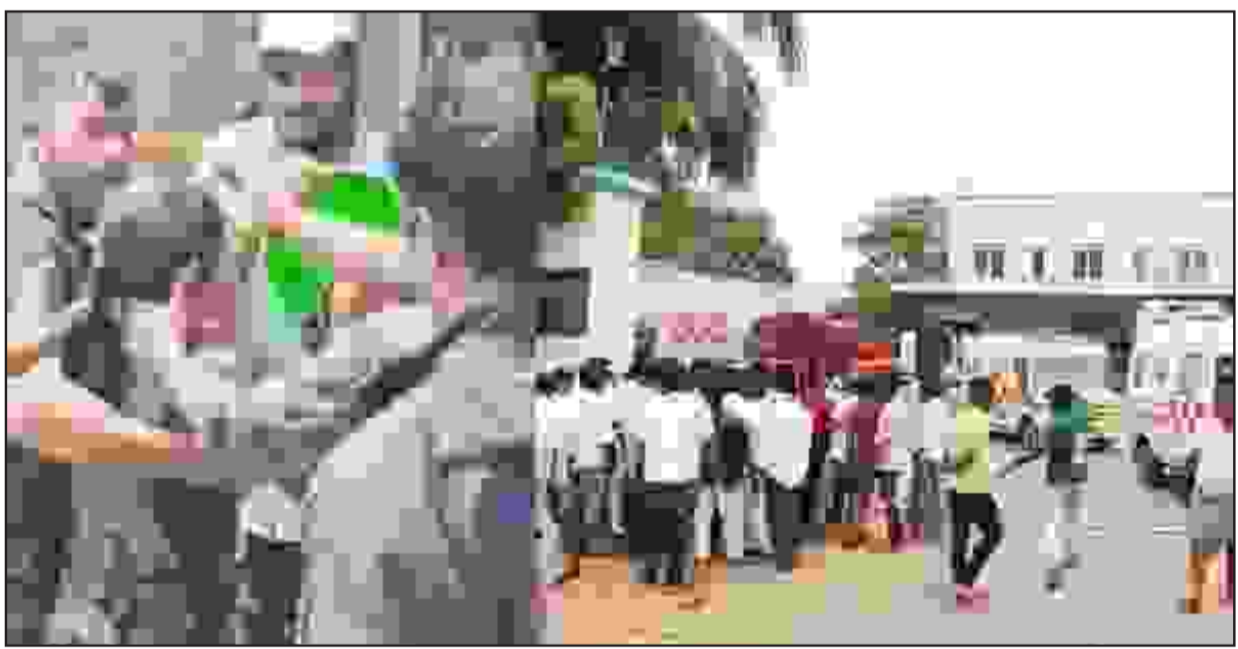
திருவள்ளூர் மாவட்டம் பெரியபாளையம் அருகே உள்ள தனியார் மீன் உணவு ஏற்றுமதி தொழிற்சாலையில் ஏற்பட்ட பயங்கர அம்மோனியா வாயு கசிவு காரணமாக, 2 பெண் தொழிலாளர்கள் பரிதாபமாக உயிரிழந்த

துள்ளனர். இந்த கோர விபத்துக்கு ஆழ்ந்த இரங்கலைத் தெரிவித்துள்ள மாண்புமிகு தமிழ்நாடு முதலமைச்சர் திரு. த.வெ.க. விஜய் அவர்கள், உயிரிழந்தவர்களின் குடும்பத்தினருக்கு தலா 2 லட்சம் ரூபாய் நிதியுதவி அறிவித்து