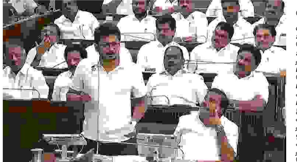
சென்னை: "மின்வெட்டு பிரச்சனையால் தொழில் முதலீடுகளை கோட்டைவிட்டு விடாதீர்கள். தமிழகத்தில் பல்வேறு இடங்களில் அறிவிக்கப்பட்டுள்ள அறிவிக்கப்பட்டு மின்வெட்டு நிலவுகிறது. சிறுகுறு தொழில்கள் மின்வெட்டால் முடங்கியுள்ளது. தமிழகத்தில் பல்வேறு இடங்களில் அறிவிக்கப்பட்டு நிலவுகிறது. முன்பெல்லாம் மழைக்கத்தான் பள்ளிகளுக்கு விடுமுறை விடுவார்கள். இப்போது மின்வெட்டுக்கு மோட்டோர் பம்பு செட்டுகள் இயக்க முடியாமல் விவசாயிகள் பாதிக்கப்பட்டுள்ளனர். இப்போது மின்வெட்டுக்கும் திமுகத்தான் காரணம் என்கிறார்கள். எங்கள் ஆட்சியில் ஏற்படாத மின்வெட்டு, இப்போது ஏற்படக் காரணம் நிர்வாக திறமையின்மையா? அல்லது தொழில்நுட்ப பிரச்சினை உள்ளதா. அதனை தீர்க்க அரசின் நடவடிக்கை என்ன என்று முதல்வர் பதில் சொல்ல வேண்டும். என்று சட்டப்பேரவையில் எதிர்க்கட்சித் தலைவர் உதயநிதி பேசினார்.

ஆளுநர் மகிழ்ச்சிதான் முக்கியமா? சட்டப்பேரவையில் எதிர்க்கட்சித் தலைவர் ஸ்டாலின் பேசுகையில், ஆளுநர் உரையின் போது தமிழகத்தாய் வாழ்த்து ஒருமுறை பாடப்பட்டது. ஆனால், தேசிய கீதம் இருமுறை பாடப்பட்டது. இதுவரை கடைபிடிக்கப்பட்ட மரபை மீறி தேசிய கீதம் இருமுறை பாடப்பட்டது. சட்டப்பேரவையில் தமிழகத்தாய் வாழ்த்து ஒருமுறை மற்றும் தேசிய கீதம் ஒருமுறை பாடுவது தான் வழக்கம். ஆனால், தேசிய கீதம் மட்டும் ஏன் 2 முறை பாடப்பட்டது. இதே கோரிக்கையை இதற்கு முன்பு இருந்த ஆளுநர் எங்கள் ஆட்சிக்காலத்திலும் வைத்தார். ஆனால், எங்கள் முதல்வர் உறுதியாக இருந்து இந்த அவையின் இறையாண்மையை காத்தார். பதவியேற்பு விழா ஆளுநர் மாளிகையில் நடந்தது. அதனால் அங்கே வந்தே மாதரம், தேசிய கீதம், தமிழகத்தாய் வாழ்த்து பாடப்பட்டது. ஆனால், சட்டப்பேரவை நமது ஆளுகைக்குள் உள்ளது. நமது ஆளுகையில் உள்ள சட்டப்பேரவையை ஏன் ஆளுநர் வசம் ஒப்படைத்தீர்கள். என்ன சமரசம் நடந்தது. ஏன் தேசிய கீதம் இருமுறை பாடப்பட்டது. அப்படியானால் தமிழகத்தாய் வாழ்த்தையும் இருமுறை பாடச் சொல்லி நீங்கள் ஆளுநரிடம் கோரிக்கை வைத்திருக்கலாம். தவகை உறுப்பினர்கள் பேசும்போது, "ஆளுநர் முன் தமிழகத்தாய் வாழ்த்து பாடிவிட்டோம்; ஆளுநர் மகிழ்ச்சியாக இருந்தார்" என மகிழ்ச்சியை தெரிவிக்கிறார்கள். தவகைவினாக்களுக்கு தமிழகத்தாய் வாழ்த்தை விட ஆளுநர் மகிழ்ச்சியாக இருந்தது தான் முக்கியம் போல தோன்றுகிறது. உங்களுக்கு ஆளுநர் முக்கியமா?