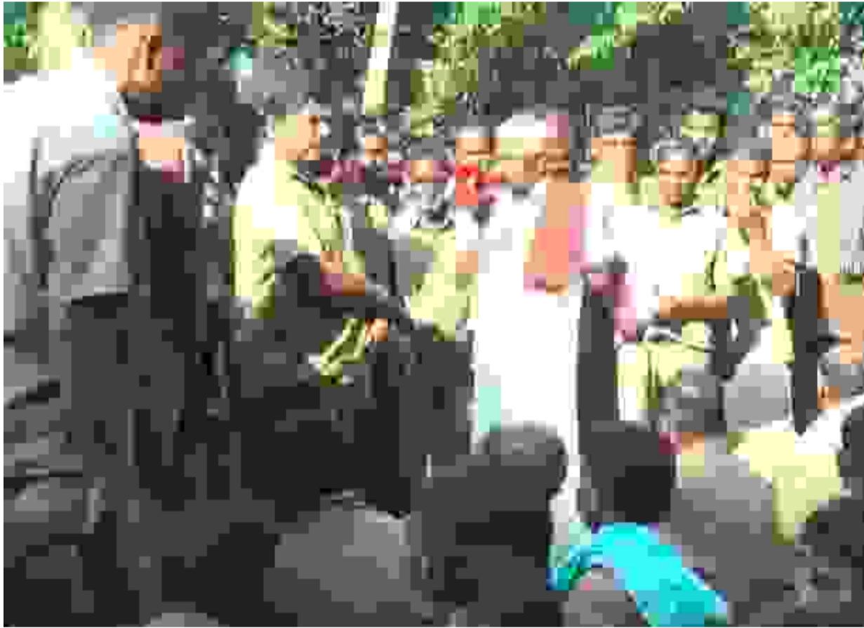
ஈரோடு மாநகராட்சியில் தூய்மைப் பணிகளை தனியார் மயமாக்கும் அரசிடமிருந்து வந்த அறிவிப்பைத் திரும்பப் பெற வலியுறுத்தி, தூய்மைப் பணியாளர்கள் பணியை புறக்கணித்து போராட்டத்தில் ஈடுபட்டுள்ளனர். அதிகாரிகள் இப்படியொரு முடிவு இல்லை என மறுத்தபோதிலும், மாநகராட்சி ஆணையாளரே நேரடியாகத் தங்களுக்கு எழுத்துப்பூர்வமான உத்தரவாதம் அளிக்க வேண்டும் என தெரிவித்தனர்.