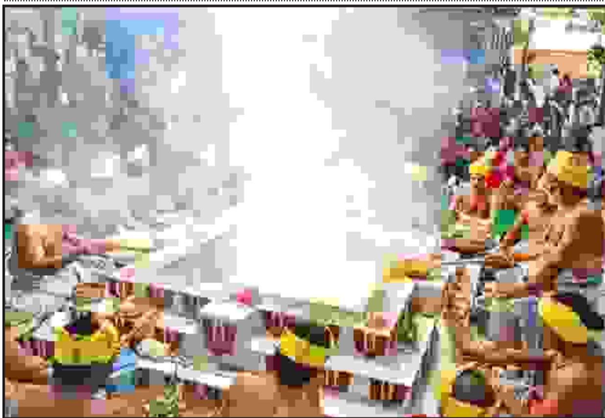
ஈரோடு மாநகர் கோட்டை பகுதியில் உள்ள அருள்மிகு ஸ்ரீ ஆருத்ரா கபாலீஸ்வரர் கோவிலில் சக்கரத்தாழ்வார் ஜெயந்தி விழாவை ஒட்டி மூன்று நாட்கள் சுதர்சன யாக பூஜை நடைபெறுகிறது. நேற்று முன்தினம் தொடங்கிய இந்த யாக பூஜை தொடர்ந்து மூன்று நாட்கள் நடைபெறுகிறது. சிவாச்சாரியார்கள் பிரமாண்டமான ஹோம குண்டம் அமைத்து இந்த சுதர்சன யாகத்தை நடத்தினார்கள். இந்த யாக பூஜையில் ஏராளமான பக்தர்கள் கலந்து கொண்டனர்.