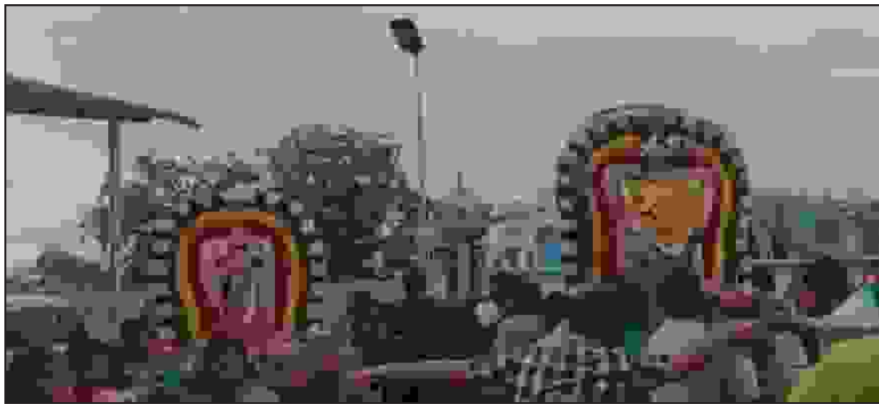
ஈரோடு மாவட்டம் கோபிசெட்டிபாளையம் பச்சைமலை அருள்மிகு ஸ்ரீ சுப்ரமணிய சுவாமி திருக்கோவிலில் சிவகாமி அம்பாள் சமேத நடராஜ சுவாமிக்கு ஆனித் திருமஞ்சன மஹா அபிஷேகம், 108 சங்காபிஷேகம், மஹா தரிசன நிகழ்வு (ஜூன்.22) அன்று நடைபெற்றது. அதன்படி நேற்று காலை 8.30 மணி முதல் 12 மணி வரை நடராஜர் மஹா ஹோமம், 12 மணிக்கு மஹா அபிஷேகம், 1.30 மணிக்கு 108 சங்காபிஷேகம், 2 மணிக்கு மஹா தீபாராதனை, நடராஜர் ஆனந்த நடன தரிசன நிகழ்வு நடைபெற்றது.