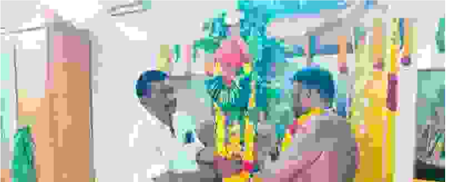
விசை மற்றும் இணைந்து கோவில் நிர்வாகிகள், கொடைவிழா ஆலோசகர்கள், கொடைவிழா குழுவினர் மற்றும் உள்ளூர் இளைஞர் அணி & மகளிர் அணியினர் மிகச்சிறப்பாகச் செய்து வருகின்றனர்.

தூத்துக்குடி மேலச் சண்முகபுரம், தங்கையா நாடார் தெரு (வண்ணார 3ம் தெரு தொடர்ச்சி) பகுதியில் அமைந்துள்ள புகழ்பெற்ற அருள்மிகு ஸ்ரீ முத்துமாரி அம்மன் ஆலயத்தின் கொடைவிழா இன்று காலை 10.35 மணிக்கு மேல் 11.45 மணிக்குள் ஆலயத்தில் பாரம்பரிய மிக்க கால்நாட்டு விழா சிறப்பாக நடைபெற்றது. கோவில் விழாவில் 9 நாட்கள் நடைபெறும் திருவிழா: இன்று துவங்கியுள்ள இக்கொடைவிழாவானது வரும் 01.07.2026 வரை தொடர்ந்து 9 நாட்களுக்கு மிக விமரிசையாக நடைபெற உள்ளது. விழாவின் முக்கிய நிகழ்வான கோவில் கொடைவிழா வரும் ஜூன் 30-ம் தேதி (ஆனி மாதம் 17-ம் தேதி) செவ்வாய்க்கிழமை அன்று மிகச் சிறப்பாக நடைபெறவிருக்கிறது. கலை நிகழ்ச்சிகளும் ஆன்மீக நிகழ்வுகளும் விழா நடைபெறும் 9 நாட்களும் தினமும் மதியம் மற்றும் இரவில் அம்மனுக்குச் சிறப்புப் பூஜைகளும், தீபாராதனைகளும் நடைபெறுகின்றன. இவற்றுடன் பக்தர்களை மகிழ்விக்கும் வகையில் பல்வேறு ஆன்மீக மற்றும் கலை நிகழ்ச்சிகளுக்கு ஏற்பாடு செய்யப்பட்டுள்ளது. ஆன்மீக சொற்பொழிவு, வில்-