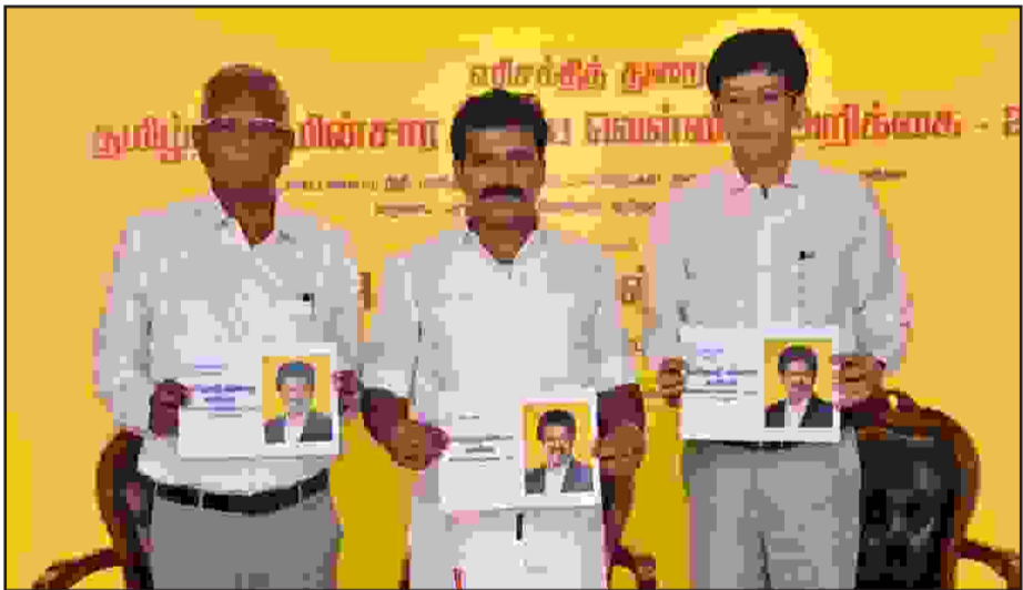
சென்னை: தமிழ்நாடு மின்சார வாரியத்தின் (TANGEDCO) ஒட்டு மொத்த கடன் ரூ. 2.47 லட்சம் கோடி என எரிசக்தித் துறை அமைச்சர் சி.டி.ஆர். நிர்மல் குமார் இன்று வெளியிட்ட வெள்ளை அறிக்கையில் தெரிவிக்கப்பட்டுள்ளது. தமிழகத்தில் தவகை தலைமையிலான புதிய அரசு பதவியேற்ற நிலையில், மாநிலத்தின் நிதி நிலைமை குறித்த வெள்ளை அறிக்கையை கடந்த 16-ந் தேதி நிதியமைச்சர் மரியவிலச்சன் வெளியிட்டார். இந்த நிலையில் தமிழ்நாடு

மின்சார வாரியத்தின் கடந்த 25 ஆண்டு கால நிதிநிலை, உள்கட்டமைப்பு மற்றும் செலவினங்கள் குறித்த வெள்ளை அறிக்கையை அமைச்சர் சி.டி.ஆர். நிர்மல் குமார் இன்று வெளியிட்டார். அதன் முக்கிய அம்சங்கள் வருமாறு: அதிரவைக்கும் நிதி நெருக்கடி மற்றும் கடன் சுமை தமிழ்நாடு மின்சார வாரியத்தின் தற்போதைய மொத்த கடன் ரூ. 2,47,130 கோடி. கடந்த ஐந்து ஆண்டுகளில் மட்டும் மின் வாரியத்திற்காக வாங்கப்பட்ட கடன் ரூ. 87,399 கோடி. மின் வாரியத்தின் தற்போதைய நிதி பற்றாக்குறை ரூ. 34,447 கோடி. மின் தேவை மற்றும் உற்பத்தி நிலவரம்