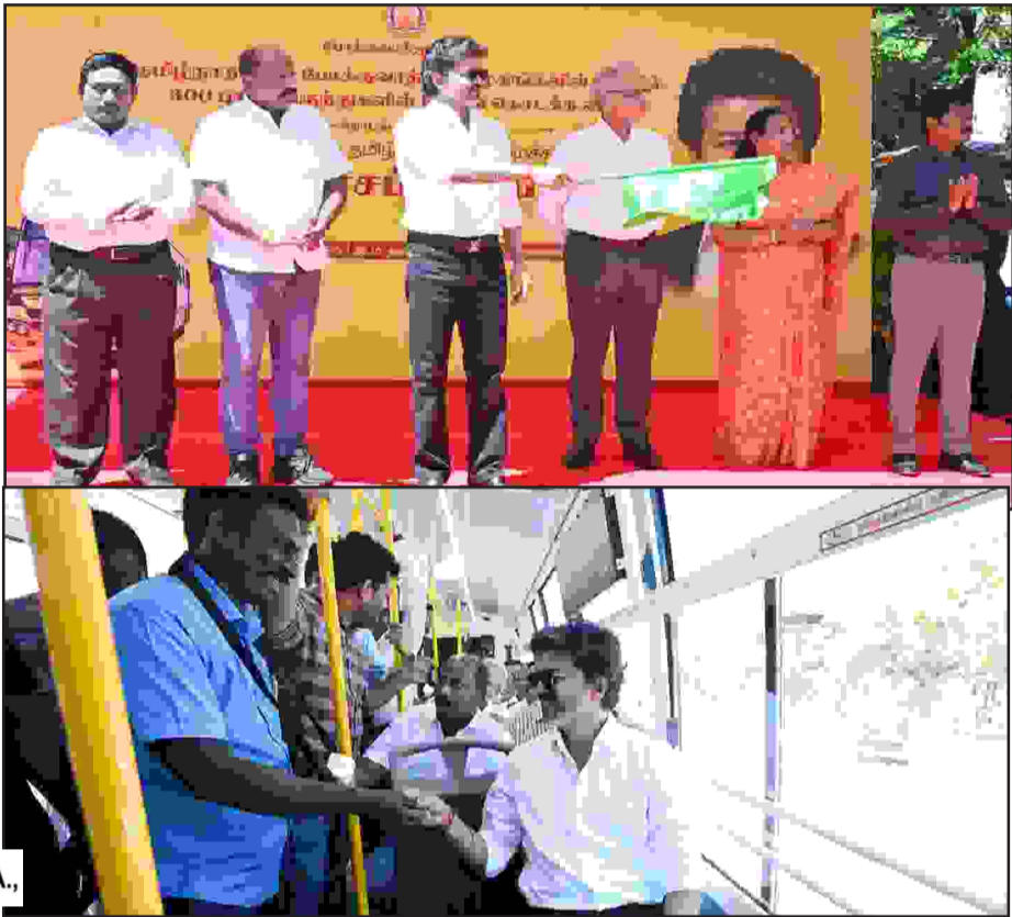
சென்னை: தமிழ்நாடு அரசு போக்குவரத்து கழகத்தின் 300 புதிய பேருந்துகளின் சேவையை சென்னை தலைமைச் செயலகம் தொடங்கி வைத்தார். தொடங்கி வைத்தது மட்டுமல்லாமல் அண்ணா சதுக்கத்தில் இருந்து பெரம்பூர் வரை செல்லக் கூடிய 29 A பேருந்தில் ஏறி அவர் பயணம் மேற்கொண்டார்.

கத்தில் முதலமைச்சர் விஜய் இன்று தொடங்கி வைத்தார். அதோடு, தி.ம.க. தலைவரான சி.வி. விஜய் இன்று தொடங்கி வைத்தார். தொடங்கி வைத்தது மட்டுமல்லாமல் அண்ணா சதுக்கத்தில் இருந்து பெரம்பூர் வரை செல்லக் கூடிய 29 A பேருந்தில் ஏறி அவர் பயணம் மேற்கொண்டார். பேருந்தில் ஏறியவுடன் ஓட்டுநர் மற்றும் நடத்துநருக்கு