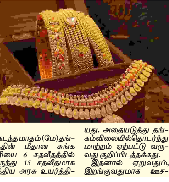
கடந்த மாதம் (மே) தங்கத்தின் மீதான சங்க வரியை 6 சதவீதத்தில் இருந்து 15 சதவீதமாக மத்திய அரசு உயர்த்தியது. அதையடுத்து தங்கம் விலையில் தொடர்ந்து மாற்றம் ஏற்பட்டு வருவது குறிப்பிடத்தக்கது. இதனால் ஏறுவதும், இறங்குவதுமாக ஊச-

சென்னை: தங்கம் விலை தொடர்ந்து மூன்றாவது நாளைக் குறைந்திருக்கிறது. அந்த வகையில் (வியாழக்கிழமை), சென்னையில் 22 காரட் ஆபரணத் தங்கம் விலை பவுனுக்கு ரூ.1,680 குறைந்துள்ளது. சர்வதேச பொருளாதார மற்றும் அரசியல் சூழல், கச்சா எண்ணெய் விலை, அமெரிக்க டாலருக்கு நிகரான இந்திய ரூபாயின் மதிப்பு, தங்கத்தின் மீதான முதலீடு, உலக பங்குச் சந்தை செயல்பாடு உள்ளிட்டவற்றின் அடிப்படையில் தங்கத்தின் விலை நிர்ணயிக்கப்படுகிறது.