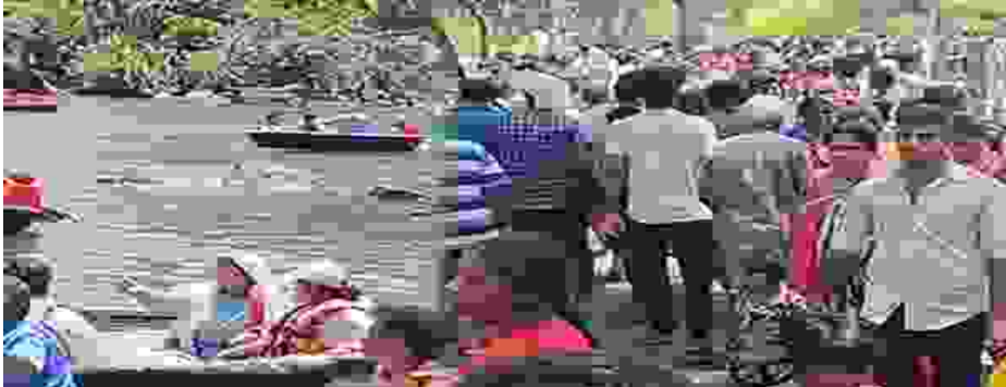
தமிழகத்தின் முக்கிய சுற்றுலா தலமான தர்மபுரி மாவட்டம் ஒகேனக்கல்லுக்கு கர்நாடகம், ஆந்திரா, கேரளா உள்ளிட்ட பல்வேறு மாநிலங்களில் இருந்தும், தமிழகத்தின் பல்வேறு மாவட்டங்களில் இருந்தும் தினமும் ஏராளமான சுற்றுலா பயணிகள் வந்து செல்வார்கள். அவர்கள் அருவியில் குளித்தும், பரிசலில் சென்றும் மகிழ்வார்கள்.

பரிசல் சவாரி இந்த நிலையில் வார விடுமுறையை யொட்டி இன்று ஏராளமான சுற்றுலா பயணிகள் ஒகேனக்கல்லில் குவிந்தனர். அவர்கள் எண்ணெய் மசாஜ் செய்து கொண்டு காவிரி ஆற்றில் பல்வேறு இடங்களில் குளித்தனர். பின்னர் அவர்கள் குடும்பத்தினர், நண்பர்களுடன் பாதுகாப்பு உடை அணிந்து பாறைகளுக்கு இடையே காவிரி ஆற்றில் உற்சாகமாக பரிசல் சவாரி சென்று மகிழ்ந்தனர். சுற்றுலா பயணிகள் முதுகைப் பின்புறம் பிடித்துக் கொண்டு குவிந்தனர். சுற்றுலா பயணிகள் வருகை அதிகரித்ததால் கடைகள், உணவகங்களில் விற்பனை விற்பனை நடைபெற்றது. ஒகேனக்கல்லில் சுற்றுலா பயணிகள் குவிந்ததால் போலீசார் ஆலம் பாடி, மணல் திட்டி, மெயின் அருவி, பரிசல் துறை உள்ளிட்ட பகுதிகளில் தீவிர ரேரந்து சென்று கண்காணித்தனர்.